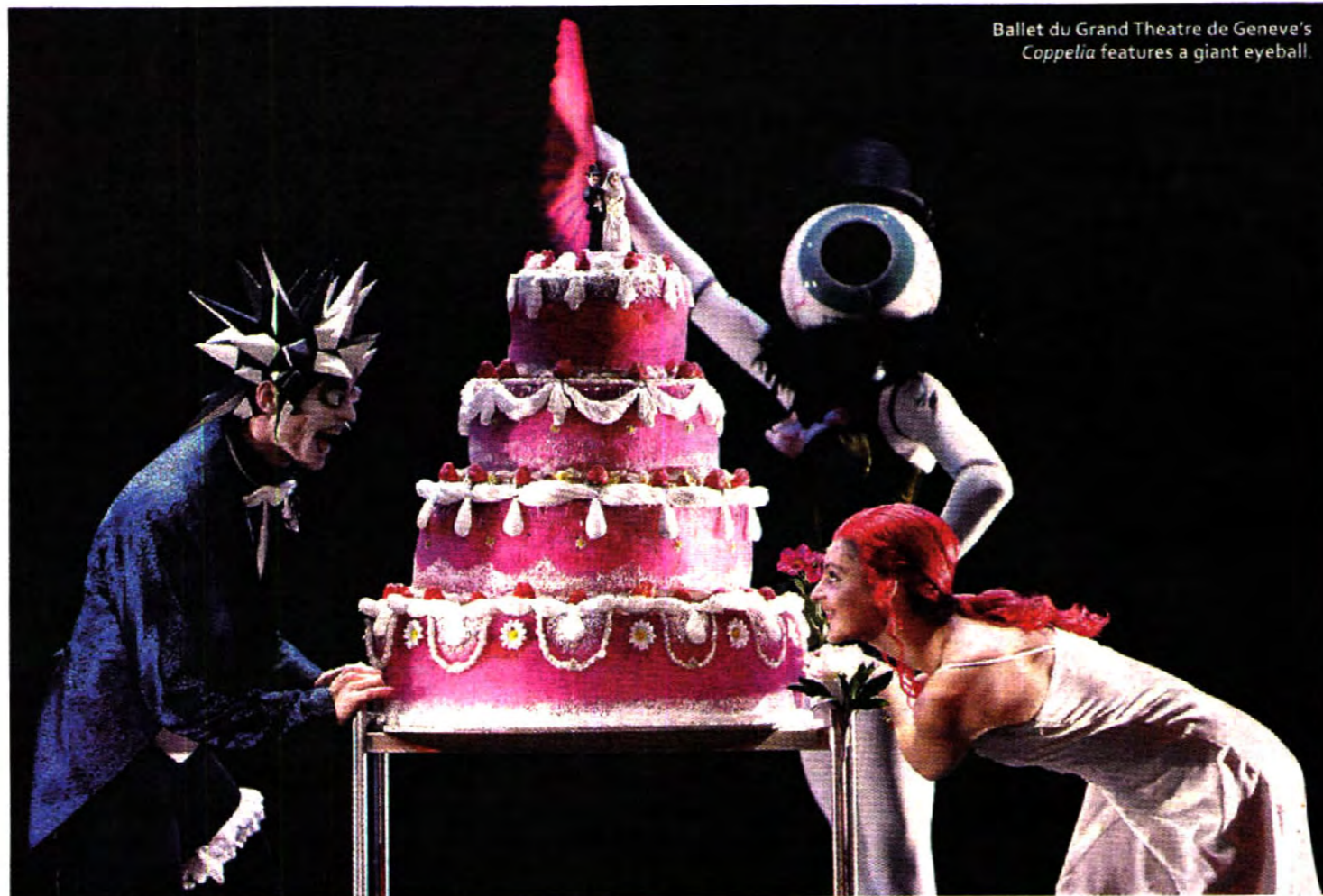
Ballet du Grand Theatre de Geneve's Coppelia features a giant eyeball.

Ditto Japan's Leni-Basso for Ghostly Round , which will be using computers to