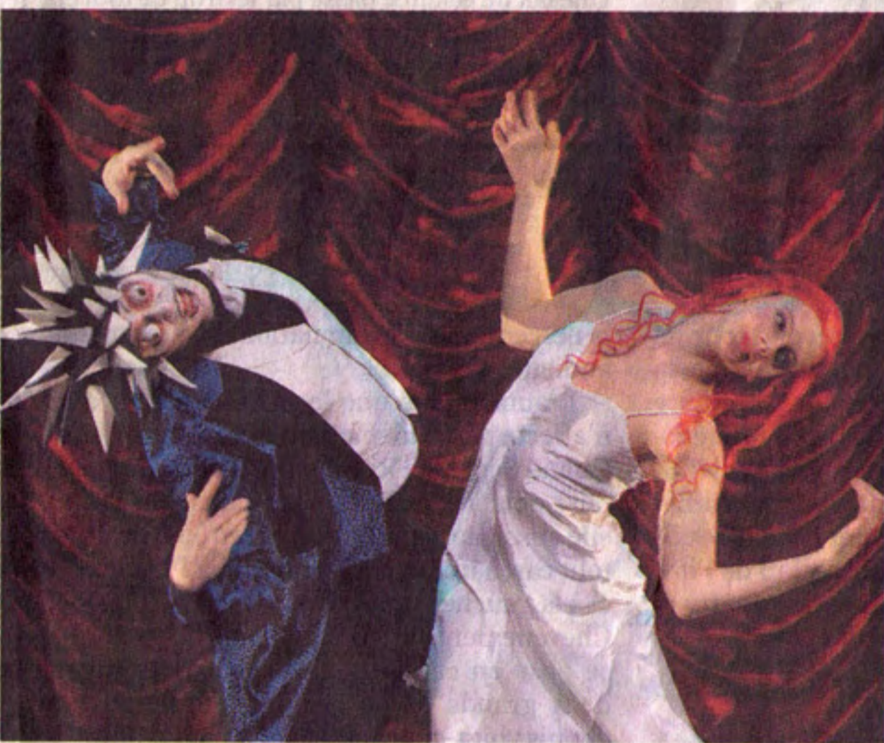
« Coppélia » au Grand Théâtre de Genève.

Peut-on rajeunir les classiques de la danse ? En s'attaquant à Coppélia , créé en 1870, d'après un conte fantastique d'Hoffmann, sur une musique de Léo Delibes, deux chorégraphes contemporains ont répondu à cette question de manière radicalement différente, mais avec succès.