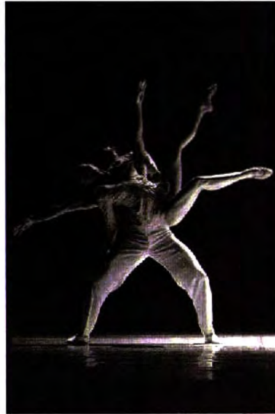
Dance showcase: Nederlands Dans Theater returns with Silent Screen (left) while Ballet du Grand Theatre de Geneve will present Coppelia (right)

Well-known companies and dancers are expected to be well received by fans when the annual dance event takes place in October, reports UMA SHANKARI