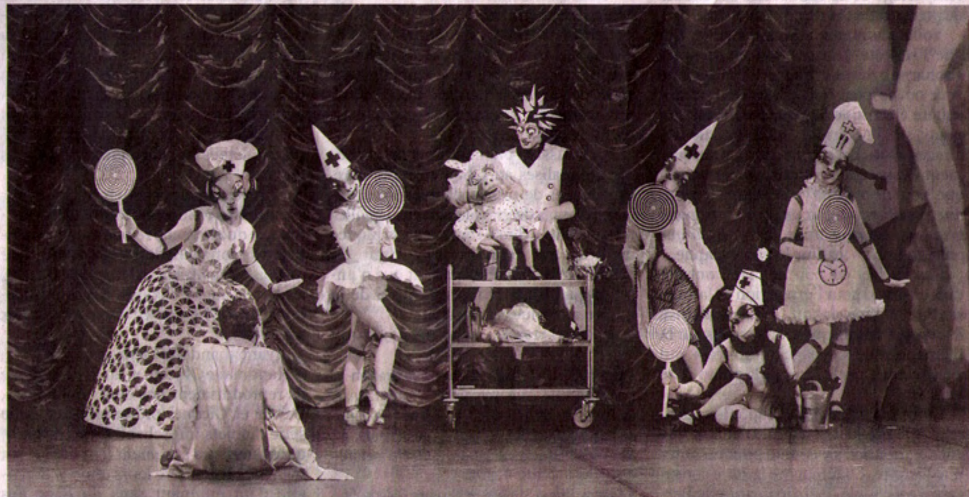
Chorégraphie de Cisco Aznar pour « Coppélia » de Léo Delibes, par le Ballet du Grand Théâtre de Genève.

Coppélia , de Patrice Bart, Opéra Bastille, Paris-12 e . M o Bastille. Tél. : 08-92-89-90-90. Jusqu'au 4 janvier 2007. De 5 € à 130 €.