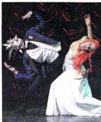
The eccentric Dr Coppelius is obsessed with his doll, Coppelia, who turns into a real-life girl.

For instance, in the original, Franz sees Coppelia sitting on a balcony reading a book. In this version, he looks up at her as she stands in a giant gilded cage.