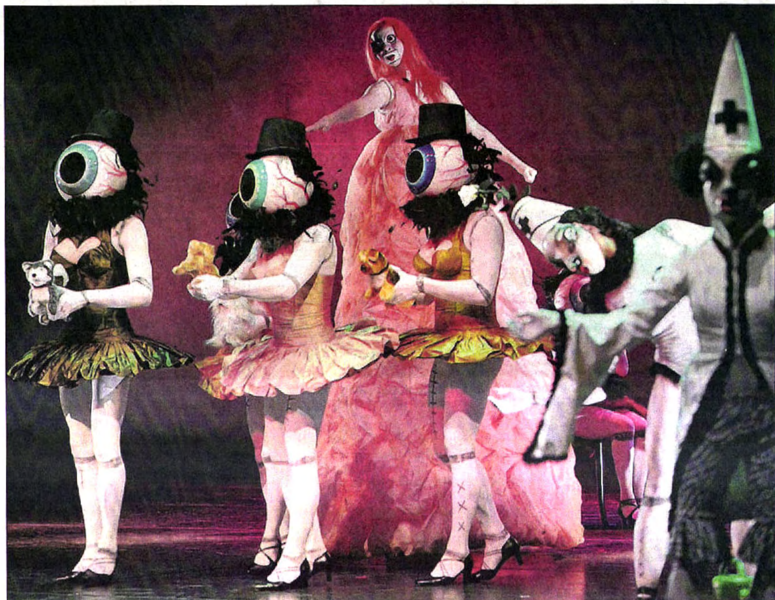
The desirable Coppelia stands tall in a long, red dress as dancing eyeballs with toy dogs greet visitors with yaps and growls.