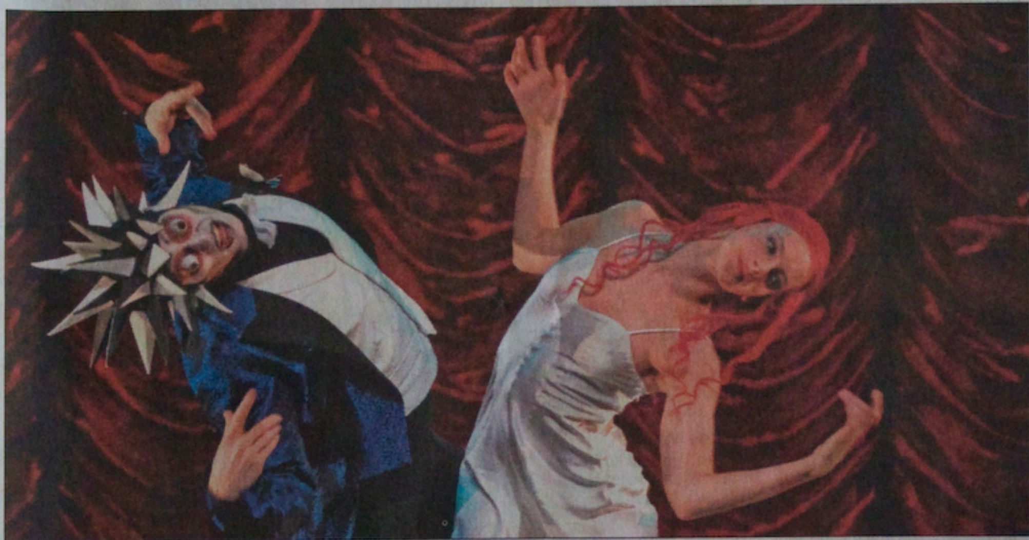
Dr Coppélius et Coppélia. Un spectacle créé à Genève en décembre 2006.