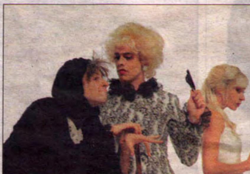
«Coppélia». Le Ballet du Grand Théâtre en répétition.