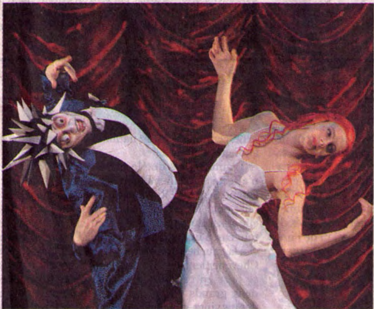
« Coppélia » au Grand Théâtre de Genève.

Peut-on rajeunir les classiques de la danse ? En s'attaquant à Coppélia , créé en 1870, d'après un conte fantastique d'Hoffmann, sur une musique de Léo Delibes, deux chorégraphes contemporains ont répondu à cette question de manière radicalement différente, mais avec succès.